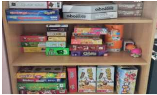
보드카페(보드게임, 닌텐도 스위치)