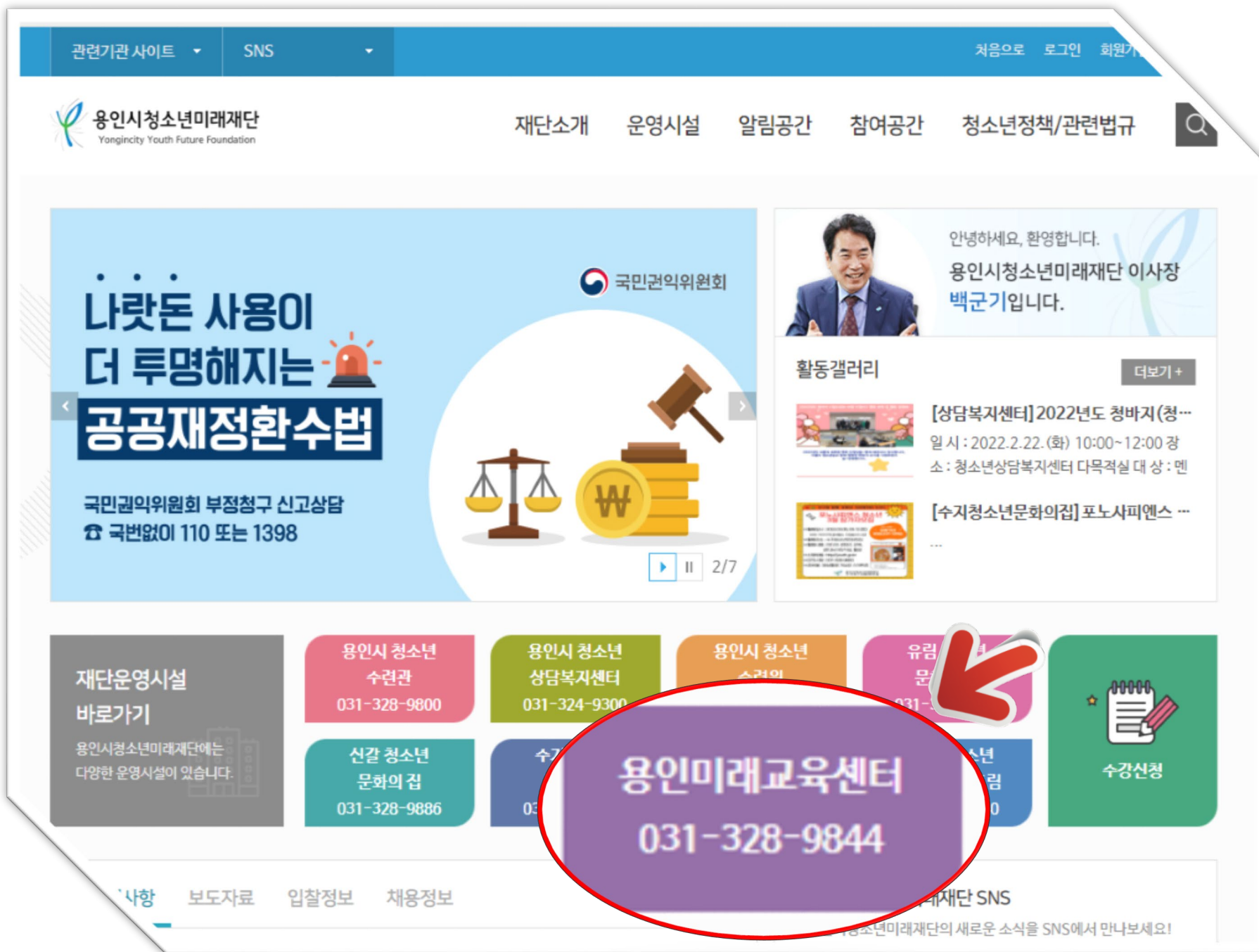
[원클릭시스템(재단) 메인화면] #1

# 용인시청소년미래재단 – 용인미래교육센터 # 용인미래교육센터 - 혁신교육「원클릭」