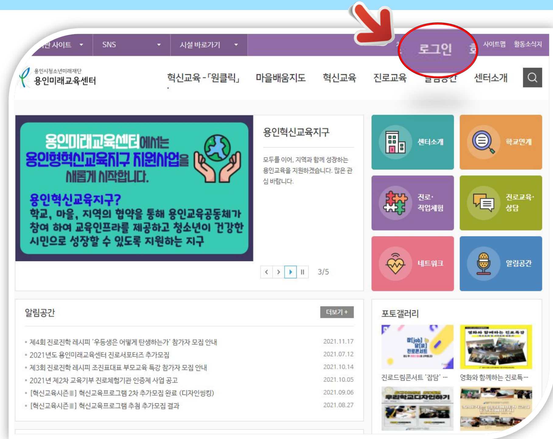
[원클릭시스템 메인화면] #2